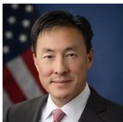
米国商務省次官補代理 (旅行・観光) マーク・キーム氏