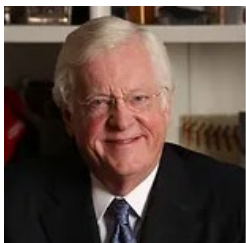
元駐日米国大使 トーマス・シーファー氏