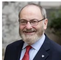
ジョンズホプキンス大学 高等国際関係研究大学院(SAIS) ライシャワー東アジア 研究センター長 ケント・カルダー氏