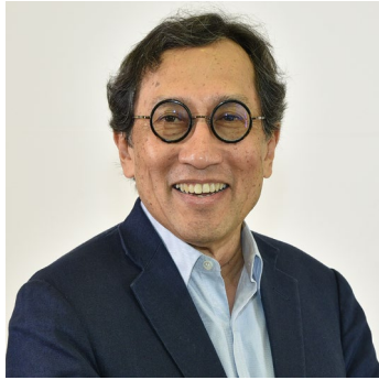
ビラハリ・カウシカン氏 元シンガポール外務次官