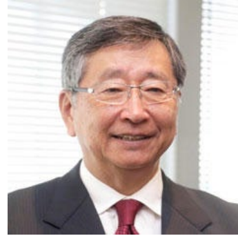
鶴岡 公二氏 元英国駐劔特命全権大使 国際情勢研究所長