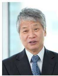
石田 東生 (いしだ はるお)

1989年京都大学大学院工学研究科博士後期課程単位取得退学。工学博士。1989年京都大学工学部助手、カリフォルニア大学客員研究員、ノルウェー王立都市地域研究所文部省在外研究員、岡山大学環境理工学部助教授、2002年同教授等を経て、2009年より現職。2015年より公益社団法人日本交通計画協会代表理事、2021年より社会資本整備審議会都市計画・歴史的風土分科会分科会長。コンパクトシティ研究で文部科学大臣賞(科学技術賞)(2021年)、都市計画学会石川賞(2022年)、ほか土木学会・不動産学会・都市計画学会等で論文賞受賞多数。『世界のコンパクトシティ』(編著、2019年、学芸出版社)のほか多数の著書を執筆。