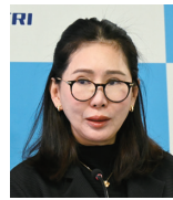
ナッターリヤー・タウィーウォン タイ観光スポーツ省次官