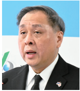
ウィッチュ・ウェチャーチャーワ 駐日タイ王国特命全権大使