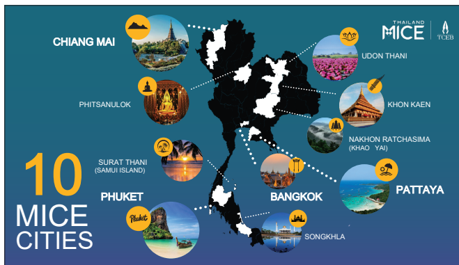
スパニッチ部長の発表資料

タイの事例では、TCEBがMICE産業のコネクターとして、全国の主要MICE都市をつなぎ、政府機関と民間事業者のマッチングを行い、主要都市だけでなく10のMICE都市へと機会を広げている。各都市は独自の強みと体験を持ち、会議・インセンティブ旅行・地域文化と連動したイベントなど多様なMICEを実施可能である。また、地域の祭りを国際市場に向けたプロモーションに活用し、文化とMICEを組み合わせることで価値創造を可能にしており、チェンマイでは年間12の祭りや連携した取組が行われている。戦略的な協働は、短期成果のみならず目的地の価値を長期的に高め、価格競争ではなく独自性・体験価値で競争する基盤となる。MICEを地方へ広げることで経済の強靱性・持続性が高まり、バランスある地域開発が観光業界全体の発展を可能にする。