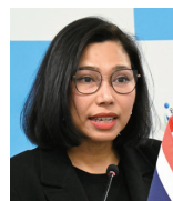
「調整から競争力へ」持続可能なMICE 目的地を共創するCVB/DMOの進化する役割 スパニッチ・ティアンシン タイコンベンション&エキシビジョンビューロー (TCEB) 国際会議・インセンティブ部長