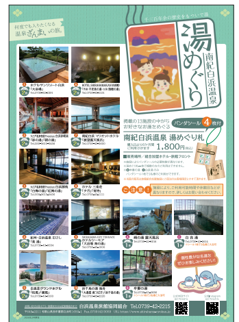
「湯めぐり札」の利用案内

出席者からの質問に対して、外国人観光客の来訪状況に関しては、海外からの観光客が多く、2024年の国別宿泊数では中国、台湾、韓国からの来訪が大半を占めているとの回答がありました。