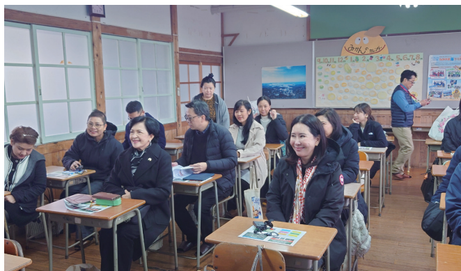
旧小学校の校舎の教室を体験コンテンツ提供の場所として活用。ランチは地元の食材を利用し、地元の主婦が作って提供している。