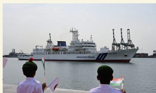
チェンナイ港に入港する練習船いつくしま