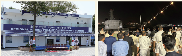
地域海洋汚染対策センター（RMPRC）練習船いつくしま船上レセプション