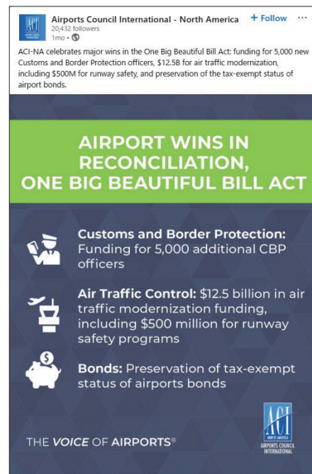
法案成立に関する北米空港評議会（ACI-NA）のSNS投稿

ACI-NAは、本法案に空港業界の優先課題が数多く盛り込まれたことを評価し、「アメリカ全体の国境警備と航空安全を強化するための重要な投資が含まれた」と歓迎の意を示している。特に、空港や港湾、陸路国境における旅客及び貨物の処理体制の向上を目的としたCBP職員5,000人の追加採用への資金提供、及び老朽化したATCシステムの抜本的な刷新については、航空の安全性と効率性の向上に資するものとして重要視した。ACI-NAは、これらの新たな投資が全国の旅行者や企業に大きな利益をもたらすとの見解を示し、トランプ政権と協力して、これらの重要な航空システム改善を可能な限り迅速に実行していく意向を表明した。