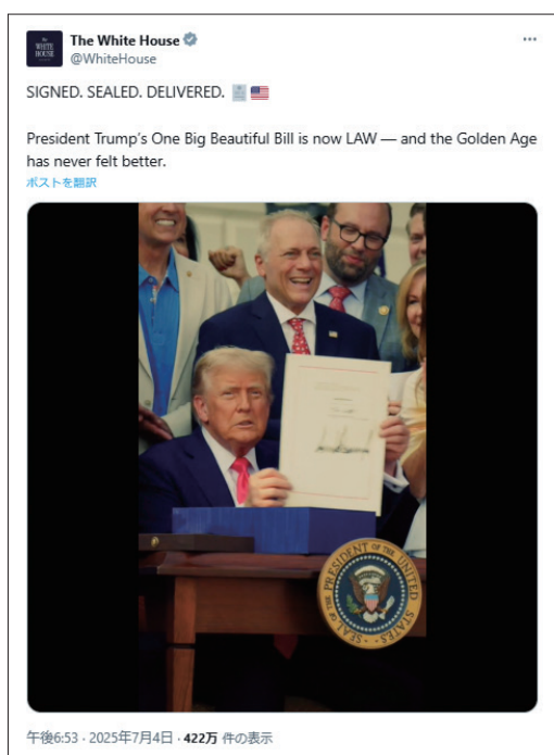
One Big Beautiful Billに署名をするトランプ大統領

本レポートでは、同法の第IV編（商業・科学・運輸委員会）を中心に、運輸交通・観光関連部分の概要を報告する。