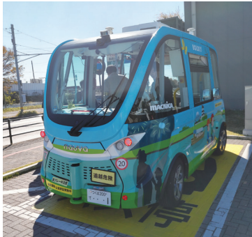
茨城県境町の自動運転車 ・走行経路上の路上駐車激減 ・バス走行中の一般車両による追い越し回数が9割減少 ※ BOLDLY資料による 7)

◆運行を主体する交通事業者や自治体は、自動運転の安全性やサービスレベルの周知や事故やトラブルに関する情報公開も広く行い、乗車体験の促進も図りながら、利用者や地域住民の理解と協力を得るべきである。