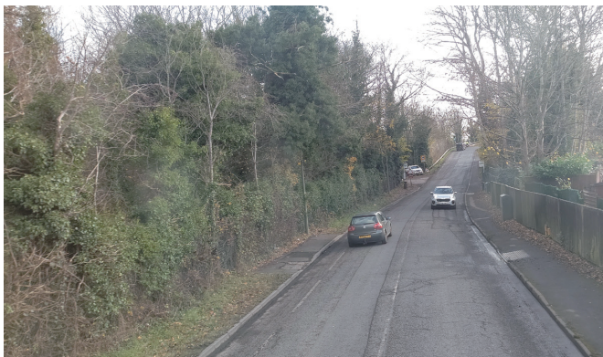
自動運転バス運行ルートにて剪定された植栽

◆利用者や地域住民は、自動運転車両がスムーズに運行できる環境構築（例：路上駐車や急な割り込みや飛出しをしない、合流時の配慮、植栽の剪定等）への協力や遵法行動、利用マナー向上（例：駆け込み乗車をしない等）をする必要がある。