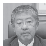
梨田和也 タイ駐箚日本国特命全権大使