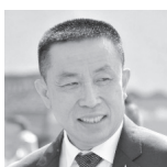
Saksayam CHIDCHOB タイ王国運輸大臣