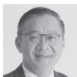
Chayatan PHROMSORN タイ王国運輸次官