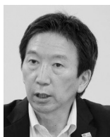
取組紹介① アドベンチャートラベルの本質と北海道における取り組みの全体像

今回のセミナーでは、アドベンチャートラベルに地域で取り組む当事者にどのように地域に貢献する観光づくりを進めているのかを語っていただき、ポストコロナにおける、質の高い、真に地域の持続的な発展・活性化に貢献する観光のあり方について普遍的なヒントと展望を得ることとした。