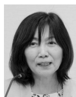
取組紹介② 熊野古道からKUMANO KODOへ ～世界に開かれた持続可能な観光地を目指して～

ATの成功例とされているヨルダントレイルを視察したところ、ローカルコミュニティの様々な方が関与して成り立っていることを実感した。