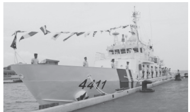
出典：在フィリピン日本国大使館、羽田大使の44m級巡視船就役式及び小型高速ボート引渡式の出席、 https://www.ph.emb-japan.go.jp/tpr_ja/00_000514.html

ASEANの国々は、南シナ海における海洋権益の主張において中国と対立しているものの、各国の経済成長に中国の「一帯一路」マナーはとて魅力的であるとともに、各国にとって最大の貿易相手国という事実を抱えており、南シナ海での問題を