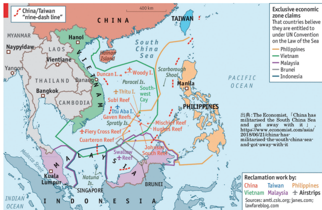
■図一2 南シナ海における各国の権利主張海域

抱えつつも、経済的には中国が極めて重要な国であるという難しい状況におかれているということを理解する必要がある。