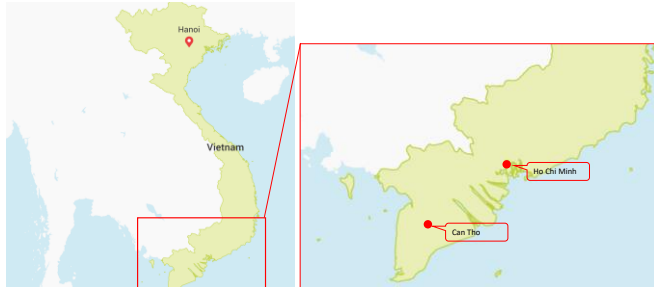
図5 ホーチミンとカントーの場所

道の計画が浮上しているが、旅客列車は時速 80ー90 キロ、貨物列車は時速 50ー80 キロと、それほど高速ではない。ホーチミンとメコンデルタの主要都市、カントーを結ぶ路線の場合、旅客は時速 200 キロ、貨物は時速 150 キロ。25 年間の BOT 方式での建設が計画されており、中国資金を頼る予定はないようだ。