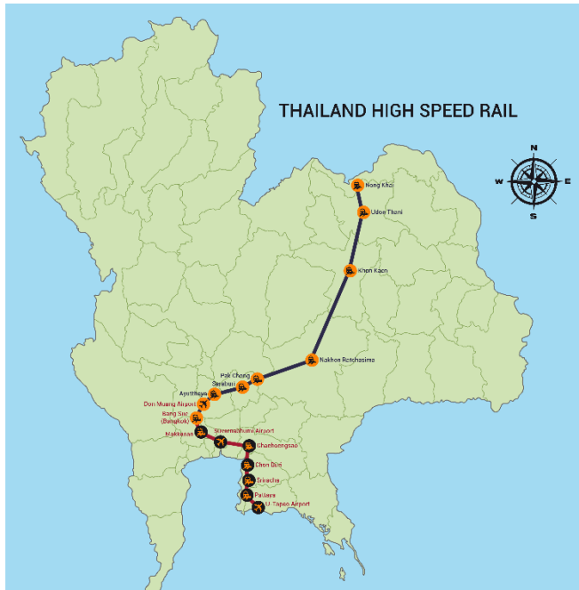
図1 タイ高速鉄道計画

Map by Free Vector Maps, https://freevectormaps.com