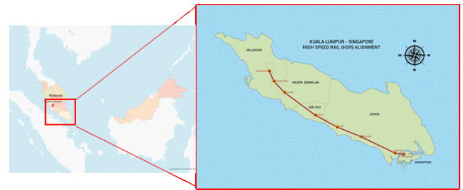
図2 KLーシンガポール高速鉄道路線図

一方、マレーシア政府は、クアラルンプールからジョホールバルまでの高速鉄道の設立の事業化調査を実施すると発表している。最も需要が見込まれるクアラルンプールーシンガポール間の設立無しで、マレーシア政府が高速鉄道を事業化するか、今後の動向が注視される。