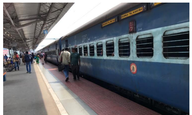
平常時のインド国鉄の駅(ケララ州コチ駅)