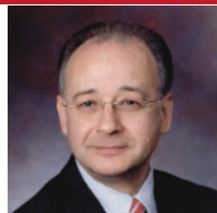
ポール・スコテラス