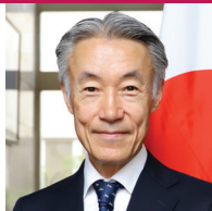
Shigeo Yamada Ambassador Extraordinary and Plenipotentiary of Japan to the United States